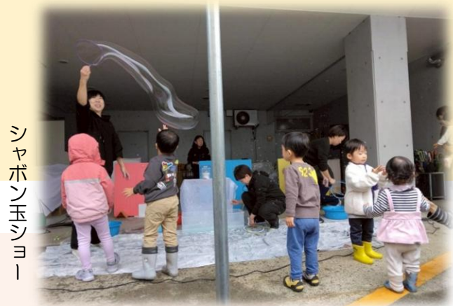
シャボン玉ショー

各事業所が協力し、模擬店やゲームコーナー、イベントなど多彩な催しを企画。利用者の皆さまやご家族、地域の方々にも楽しんでいただき、会場は笑顔と活気に包まれました。普段は異なる事業所で活動する職員同士も交流を深め、法人全体の一体感を実感する機会となりました。今回の秋まつりを通じて、地域に根ざした法人としての役割を改めて確認し、今後も皆さまに喜んでいただける取り組みを続けてまいります。