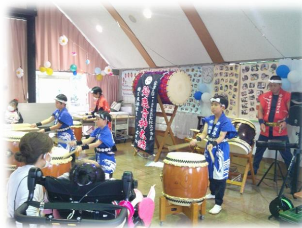
鈴鹿音神太鼓・湘南音神太鼓

今回初の試みで、子どもから大人まで楽しめるスタンプラリーを実施しました。各ポイントを巡りスタンプを集めた方には、素敵な景品をお渡ししました。