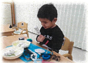
ねんどでお団子…できたー♪