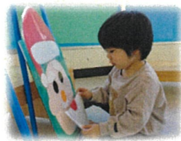
おひげはここでいいかなあ？