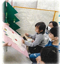
クジラができたよー！ ほくもクジラに変身☆

もうすぐ春…就園や就学に向けて、たくさんの楽しい経験と思い出を重ねていきたいと思っております。