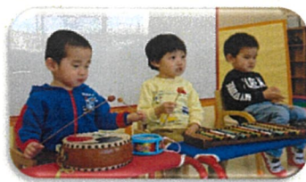
いろんな音がするね！