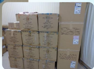
● 国や県からの支援の一部