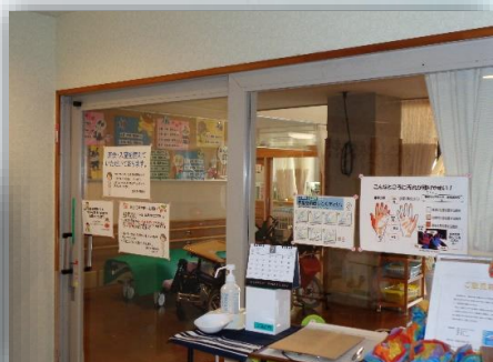
● 入館制限・面会制限