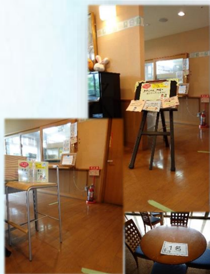
● 食堂での手指消毒・ソーシャルディスタンスの徹底、利用時の人数制限