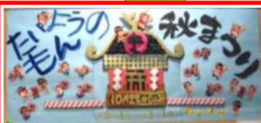
きゃんぼす 秋祭りポスター