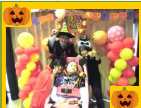
Happy HalloWeen ~いつもと違うきゃんばす~

これからもお子さまたちの笑顔がより一層輝ける様に職員一同で取り組んで参ります。この一年ありがとうございました。