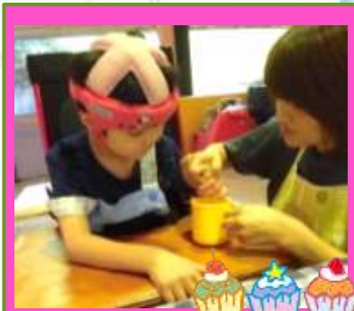
蒸しケーキに挑戦!! おいしくなあれ