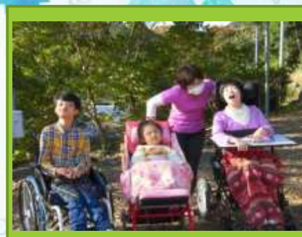
落ち葉を握ったら、シャリッ!パリッ!! ガサガサ!!!楽しかったね~♪